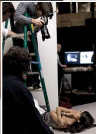
Buổi chụp diễn ra tại New York