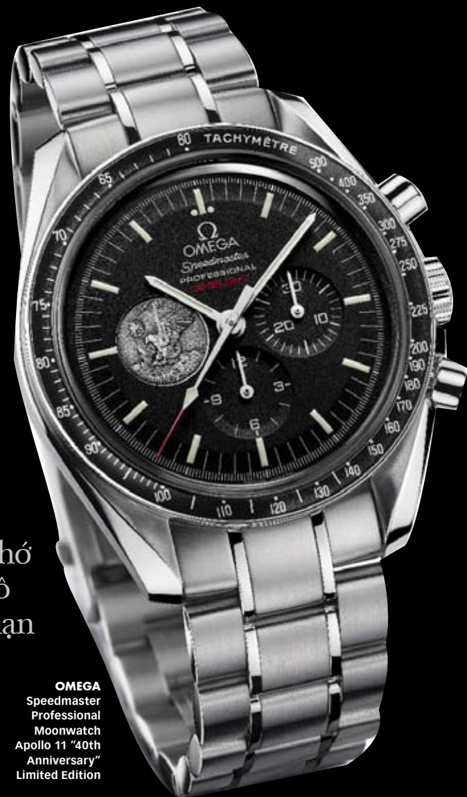
OMEGA Speedmaster Professional Moonwatch Apollo 11 "40th Anniversary" Limited Edition

đời. OMEGA Speedmaster trở thành chiếc đồng hồ đầu tiên và duy nhất có mặt trên mặt trăng. Lý do thú vị là vì hệ thống thời gian điện tử trên bộ phận hạ cánh Lunar Module không hoạt động chính xác nên Armstrong đã để lại đồng hồ của mình trên tàu để có thể chỉnh lại giờ cho đúng.